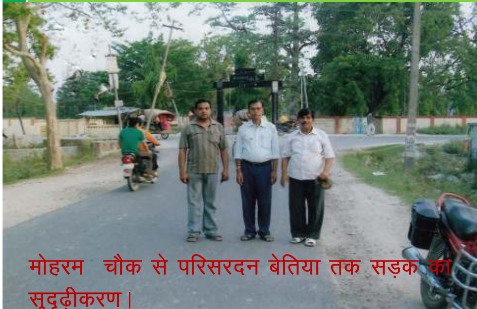
मोहरम चौक से परिसरदन बेतिया तक सड़क का सुदृढीकरण ।