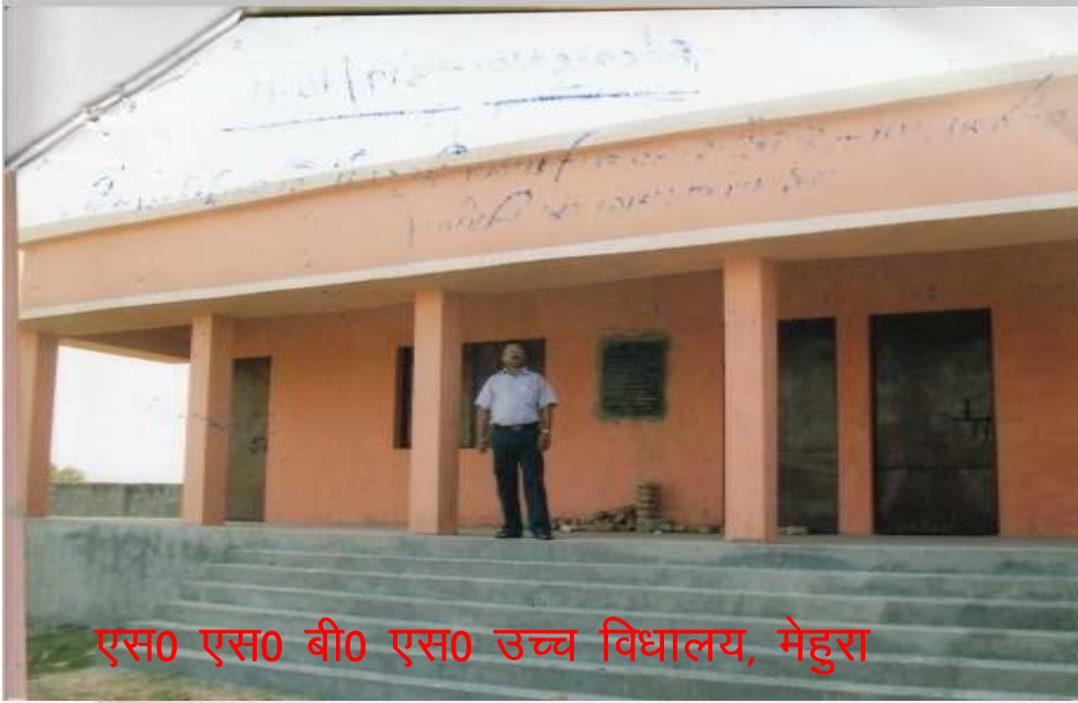
एस० एस० बी० एस० उच्च विद्यालय, मेहरा