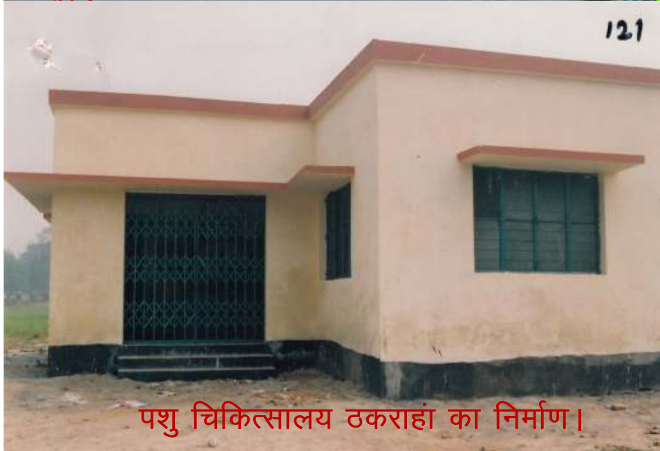
पशु चिकित्सालय ठकराहां का निर्माण ।