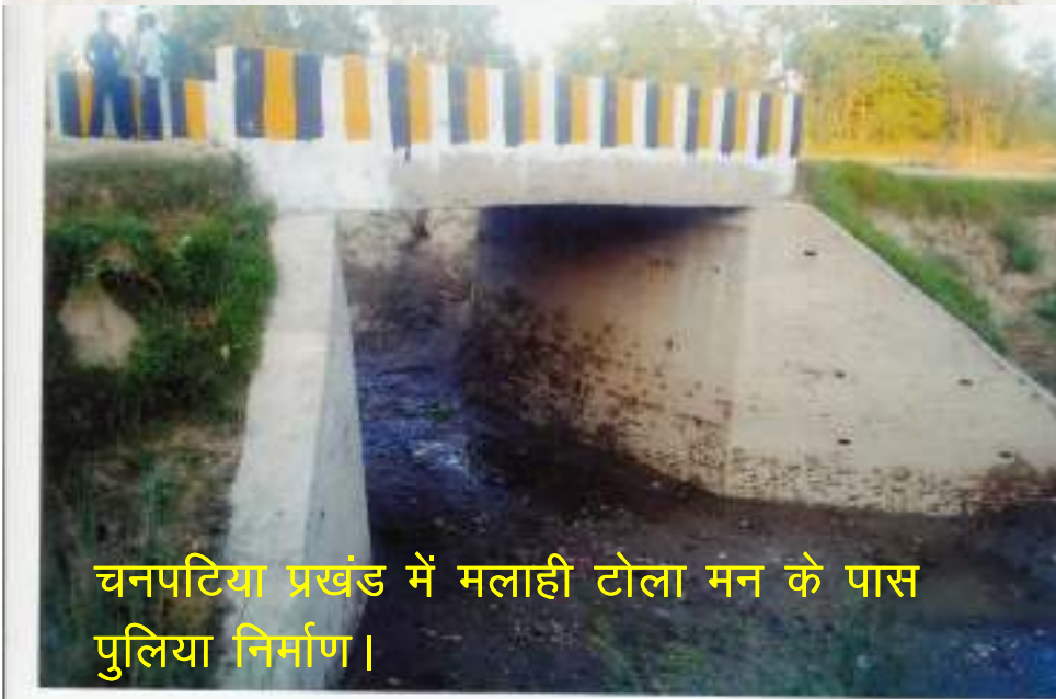
चनपटिया प्रखंड में मलाही टोला मन के पास पुलिया निर्माण।