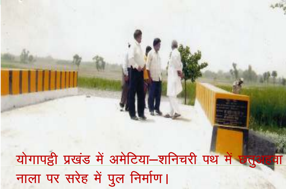
योगापट्टी प्रखंड में अमेटिया-शनिचरी पथ में छतुअडवा नाला पर सरेह में पुल निर्माण।