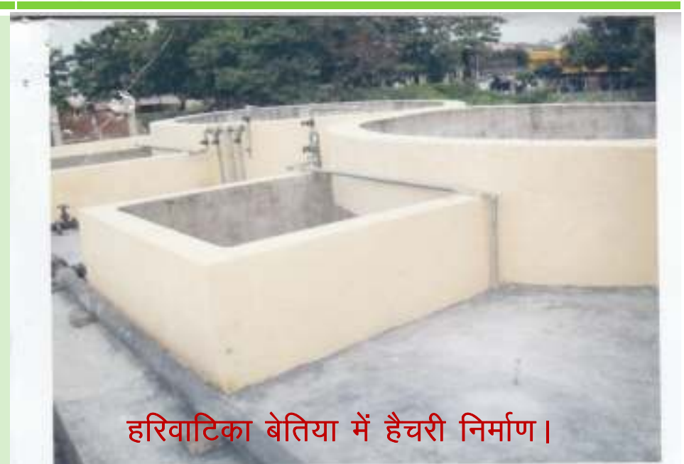
हरिवाटिका बेतिया में हैचरी निर्माण ।