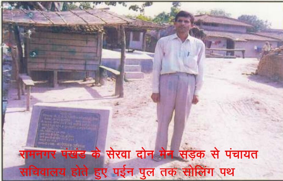
रामनगर प्रखंड के सेरवा दोन मेन सड़क से पंचायत सचिवालय होते हुए पईन पुल तक सोलिंग पथ