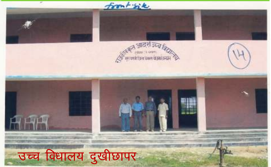
उच्च विधालय दुखीछापर