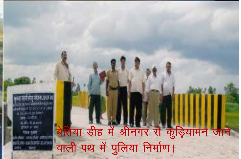
बेतिया डीह में श्रीनगर से कुड़ियामन जाने वाली पथ में पुलिया निर्माण।