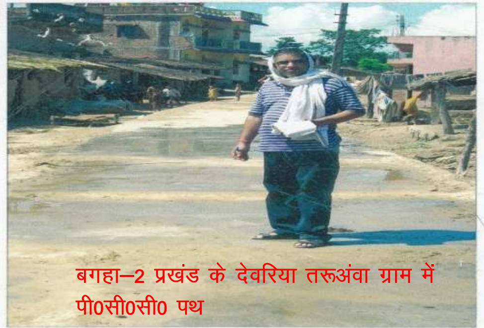
बगहा-2 प्रखंड के देवरिया तरुअंवा ग्राम में पी0सी0सी0 पथ