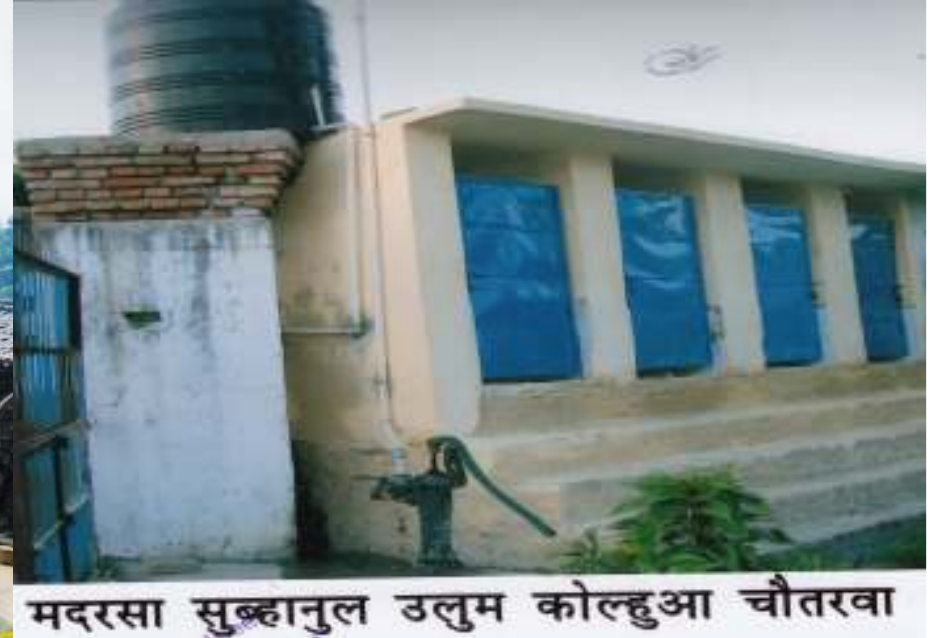
मदरसा सुब्हानुल उलुम कोल्हुआ चौतरवा