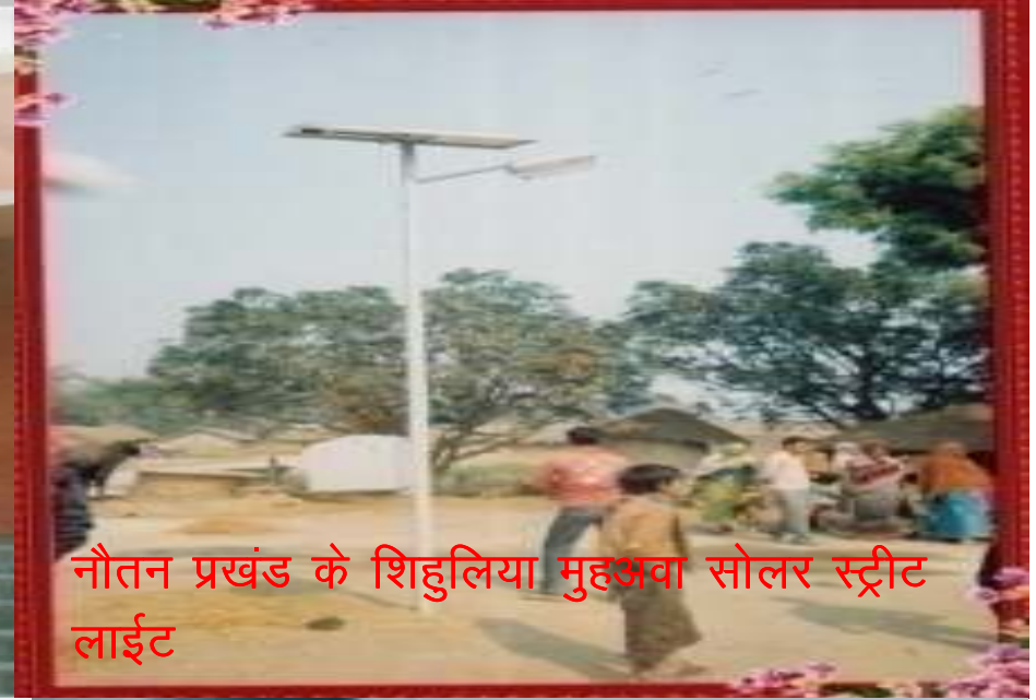
नौतन प्रखंड के शिहुलिया मुहअवा सोलर स्ट्रीट लाईट