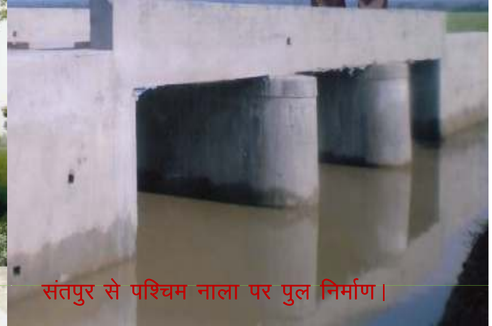
संतपुर से पश्चिम नाला पर पुल निर्माण।