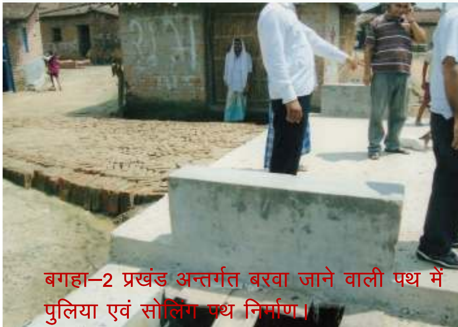
बगहा-2 प्रखंड अन्तर्गत बरवा जाने वाली पथ में पुलिया एवं सोलिंग पथ निर्माण।