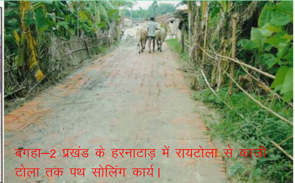
बगहा-2 प्रखंड के हरनाटाड़ में रायटोला से काजी टोला तक पथ सोलिंग कार्य।